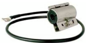
Erdungsschelle für Ecoflex® 15, Art.-Nr. 6915

Der schwarze PVC-Außenmantel von Ecoflex 15 ist UV-stabilisiert. Zur Vereinfachung der Installation wurden lötfreie Stecker in den Normen „N“, „UHF“ und „7-16DIN“ entwickelt, die ohne Spezialwerkzeuge in kurzer Zeit konfektioniert werden können. Ecoflex 15 ist ein modernes Koaxialkabel für alle Applikationen in der Hochfrequenztechnik: dämpfungsarm, flexibel, störstrahlungssicher und einsetzbar bis in den Mikrowellen-Bereich. Lieferbar in den Standardlängen 25 m, 50 m, 100 m, 200 m und 500 m.